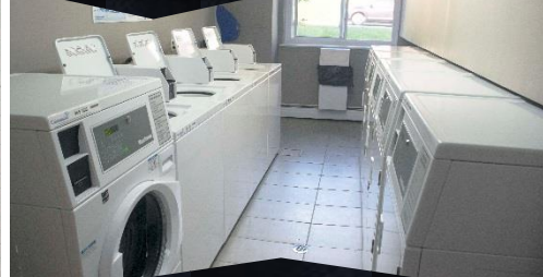
Cartes à puce machines de buanderies Smart card laundry machines