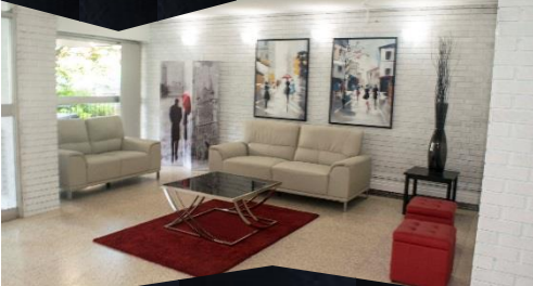
Hall d'accueil Rénové | Renovated lobby